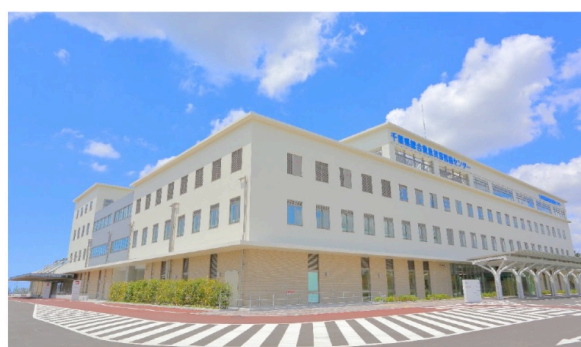
2023 年 11 月 1 日オープン 千葉県総合救急災害医療センター

(8) 病院の特色と研修内容：病床数 100 床の独立型高度救命救急センターで三次救急患者を主に扱う。指導医とともに外来での救命処置に含め、緊急手術、IVR その他の緊急治療の研修を行う。